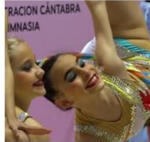
Todas las gimnastas asistieron junto a sus entrenadoras y se aplicó el protocolo covid-19 de la RFEG.